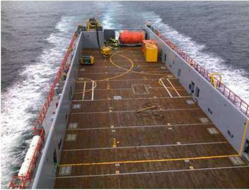
Bilde av dekk ved bruk av barrierekonteinere på Loke Viking: